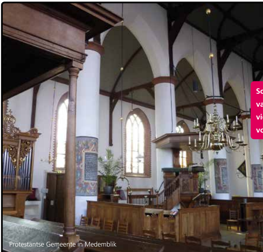
Protestantse Gemeente in Medemblik

Een goede verstaanbaarheid in de kerk is niet altijd eenvoudig te realiseren. Door een veelheid aan akoestische factoren is het nodig een professionele en ervaren partner in te schakelen.