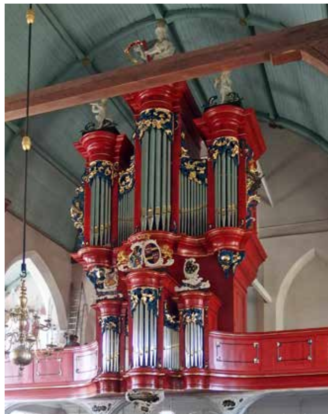
De Crane orgel van de hervormde gemeente Waspik

uit. De firma A.S.J. Dekker (Goes) restaureerde het orgel in 1920.