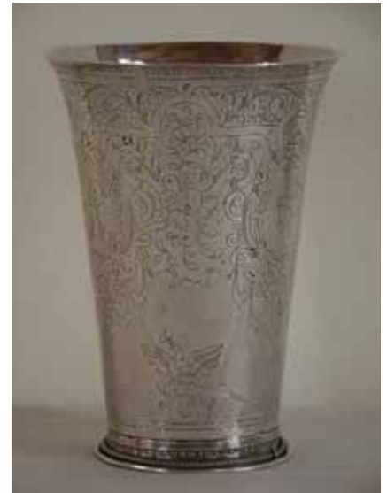
Zilveren avondmaalsbeker met Geloof, Hoop en Liefde (17de eeuw).