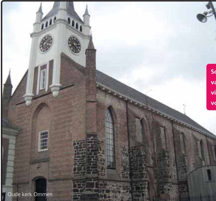
Oude kerk Ommen

Een goede verstaanbaarheid in de kerk is niet altijd eenvoudig te realiseren. Door een veelheid aan akoestische factoren is het nodig een professionele en ervaren partner in te schakelen.