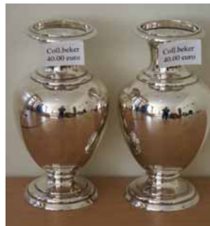
Zilveren offervazen en avondmaalskannen waren voor dezelfde prijs te koop als verzilverde exemplaren.