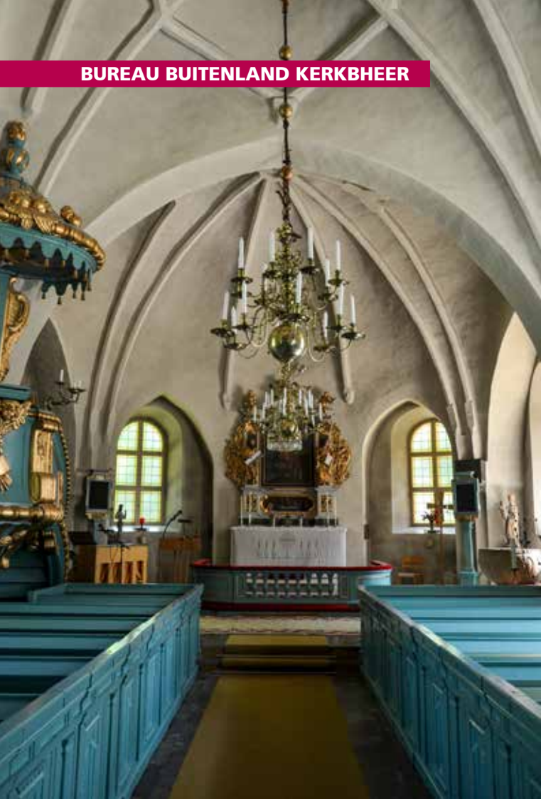
Interieur van een kerk in de omgeving van Köping.

Er worden in de geestelijkheid drie ambten onderscheiden: bisschop, priester en diaken. Het laatste ambt verdient wat toelichting: het bestaat nog niet zo lang. In de 2e helft van de 19e eeuw werden veel gemeenschappen van diaconessen gesticht, die zich bezighielden met wat wij binnenlands diaconaat zouden noemen, en met pastoraat. Rond