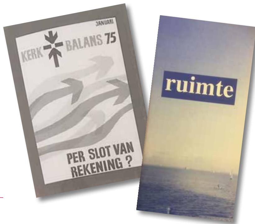
Poster voor de Actie Kerkbalans in 1975 (links) en een oude uitgave van het voorlichtingsboekje 'Ruimte' (rechts).