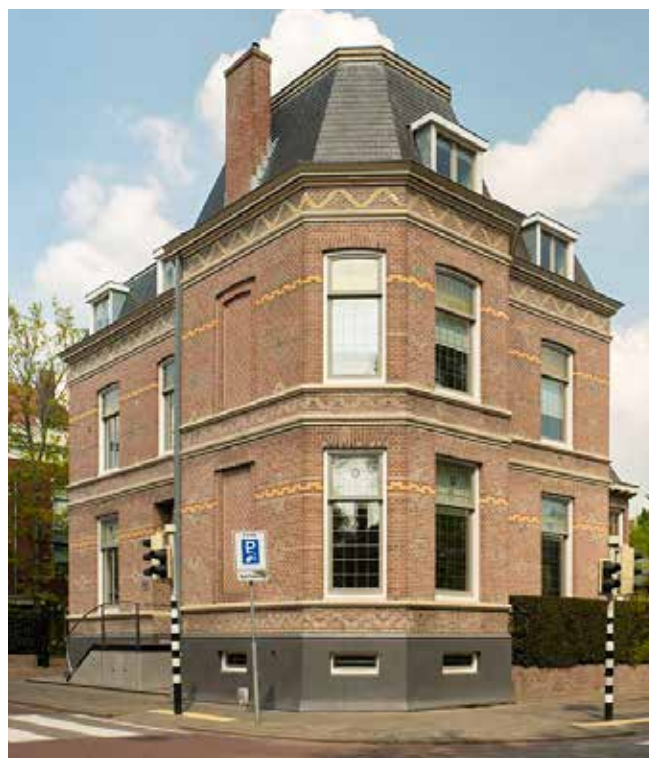
Het kantoor van de VKB aan de Vrieseweg te Dordrecht

nu al massaal gebeurt, maar we zien wel de problematiek toenemen. Plaatselijke gemeenten komen meer en meer, vroeger of later, voor echte reorganisatievraagstukken te staan. Nog lang niet alle kerkrentmeesters zijn 'wakker' genoeg om te beseffen, dat dit ook hun gemeente op de één of andere manier zal raken.