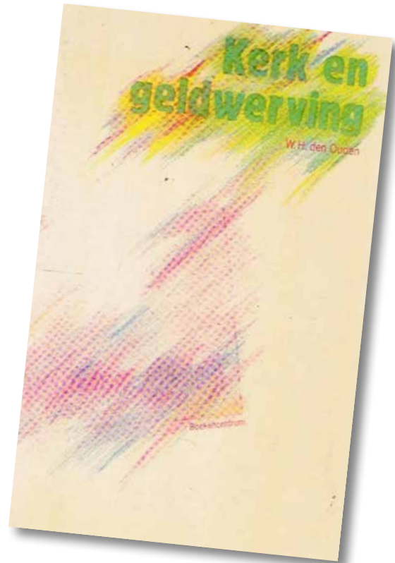
Omslag van het boekje 'Kerk en geldwerving' van W.H. den Ouden.

Na 1950 geraken de kerkvoogdijen in het defensief: voordien vooral georiënteerd op het beheer van bezittingen