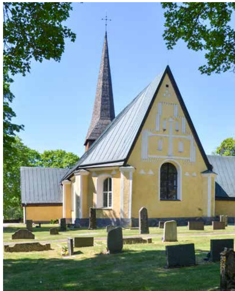
Kerkgebouw in de omgeving van Arboga

Zweden heeft onbedoeld en onbewust een belangrijke rol gespeeld in de vorming van de momenteel meest katholieke natie in Europa: Polen. Dat zit zo in elkaar: In de 16e eeuw was Polen een land waar het Katholicisme goeddeels was verdwenen (althans bij de bovenlaag van de bevolking). De reformatie toonde wel een gemengd beeld: de Duitstalige Polen omarmden de Lutherse leer, de elite die Frans sprak de leer van Calvijn, maar de grootste reformatorische stroming was vreemd genoeg een moderne variant van het Arianisme). Polen kende al sinds de middeleeuwen een traditie van het gekozen staatshoofd, en koos in 1587 prins Sigismund uit het Lutherse Zweden als koning. Maar deze koning was 'toevallig' opgevoed en gevormd door katholieke priesters. De Poolse koning had heel weinig macht (alles wat geld kostte vereiste goedkeuring van de Landdag ), maar wél het recht van benoeming. Sigismund III benoemde op alle sleutelposities katholieken. En twintig jaar later was de reformatie in Polen ernstig op zijn retour. (Bron: Adam Zamoyski, Poland: A history )