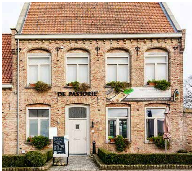
Voormalige pastorie, nu restaurant in Diksmuide

Ten aanzien van een hele zomer alvast in een woning wonen, zouden we zeggen: denk samen na over mogelijke risico's en leg een aantal afspraken tevoren vast. Je wilt immers voorkomen dat als de verbintenis onverhoopt niet doorgaat (in elk mensenleven kunnen onverwachte dingen gebeuren) er opeens vervelende juridische of morele verplichtingen opduiken. Anderzijds wil je ook niet – gesteld dat er sprake is van een drama, bijvoorbeeld een overlijden – het dan in de pastorie wonende gezin meteen de deur wijzen. Dus regel het één en ander naar analogie van wat er zou moeten gebeuren in zo'n situatie als ware het inmiddels de ambtswoning en leg dat tevoren vast in een tijdelijke huurovereenkomst.