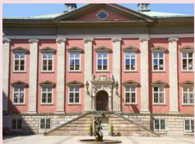
Het Louis de Geer Palats in Stockholm, gebouwd rond 1650 in een Nederlandse classicistische stijl. Het paleis huisvest sinds 1963 de Nederlandse Ambassade.

Even wat cijfers: er zijn ongeveer 5.000 priesters in de Svenska Kyrkan , waarvan circa 3.000 actief in gemeenten, en circa 1.500 gepensioneerde. Daarnaast (?) zijn er 21.600 andere medewerkers, waarvan een groot aantal voor beheer en onderhoud van kerkhoven (bijna alle kerkhoven in Zweden worden beheerd door de kerk). Een ander deel (2.500) is actief als kerkmusicus/cantor (er zijn 100.000 koorleden), en ook zijn er 2.000 kerkelijke werkers, die zich vooral bezighouden met jeugdwerk en toerusting. In iedere gemeente mag de bisschop meerdere personen toestemming geven om diensten te leiden zonder eucharistieviering. In totaal telt de kerk 27.400 gekozen vertegenwoordigers in bestuurslichamen, 27.800 vrijwilligers voor pastoraat en diaconaat, en meer dan 25.000 voor jeugd- en jongerenwerk. Er waren in 2018 nog 1337 gemeenten; dat aantal is snel dalende.