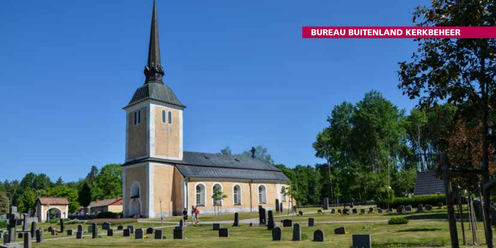
Kerkgebouw in de omgeving van Köping

met 30 priesters (inclusief bisschoppen) en 30 leken. Dat aantal werd in 1949 uitgebreid naar respectievelijk 43 en 53, en ook de bevoegdheden werden uitgebreid. Er stonden wel steeds meer discussies met de staat, die zich (nóg) wat liberaler opstelde dan de kerk: zo werd in 1957 door de Synode een voorstel voor toelating van vrouwen in het ambt afgewezen, welk besluit door het parlement in 1958 werd overruled . In 2000 werd de Svenska Kyrkan een geloofsgemeenschap die rechtens gelijkgeschakeld was met andere geloofsgemeenschappen.