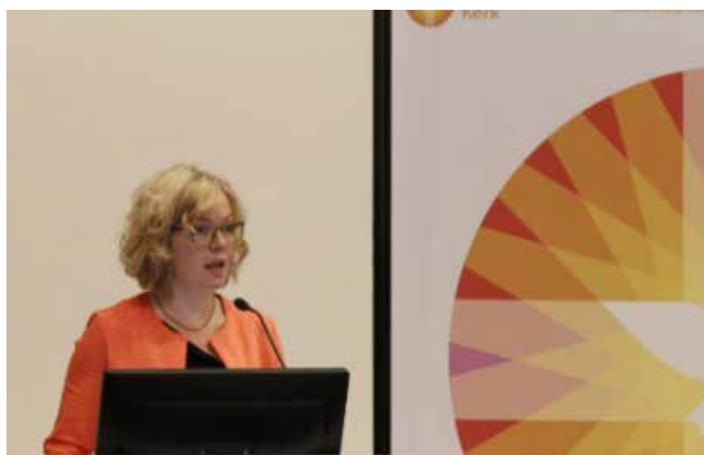
Links boven: de synode besluit over de benoemingen