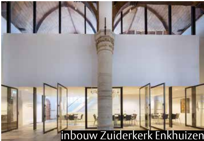
inbouw Zuiderkerk Enkhuizen