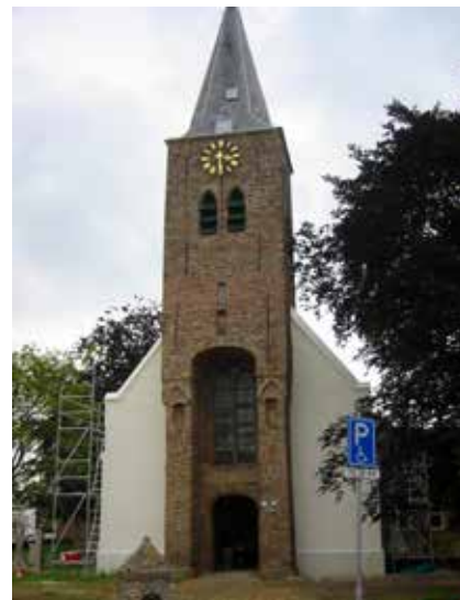
Kerk van Ovezande

Op het front van het nemen van nieuwe frisse initiatieven op missio- nair-diaconaal zijn er in het eerste deel van 2015 eveneens een aantal bijeenkomsten geweest om ideeën te ontwikkelen, onder de aanvanke- lijke werktitel 'Geloven en kerk-zijn langs nieuwe wegen'. Eerst twee- maal met groepen van ca. 10 – 20 personen en daarna in enkele werkgroepjes. Inmiddels zijn er een drietal 'project-lijnen' die alle drie een wat andere invalshoekhoek hebben. Ze kennen ook verschil- lende spiritueel-inhoudelijke accenten, waardoor onderscheiden groepen mensen gemotiveerd (kunnen) worden mee te doen.