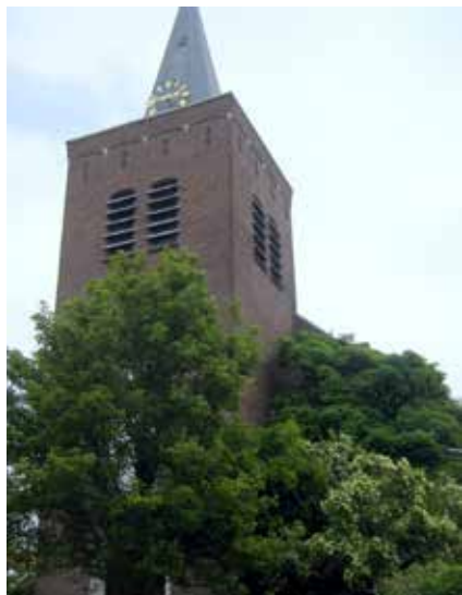
Kerk van Ellewoutsdijk