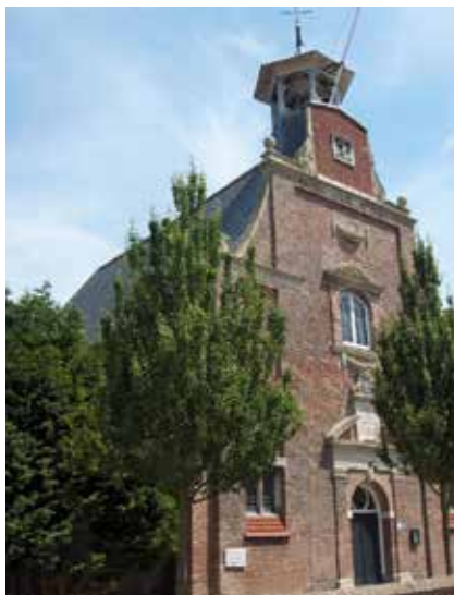
Kerk van Driewegen

Inmiddels zijn eerste afspraken gemaakt over het tempo van