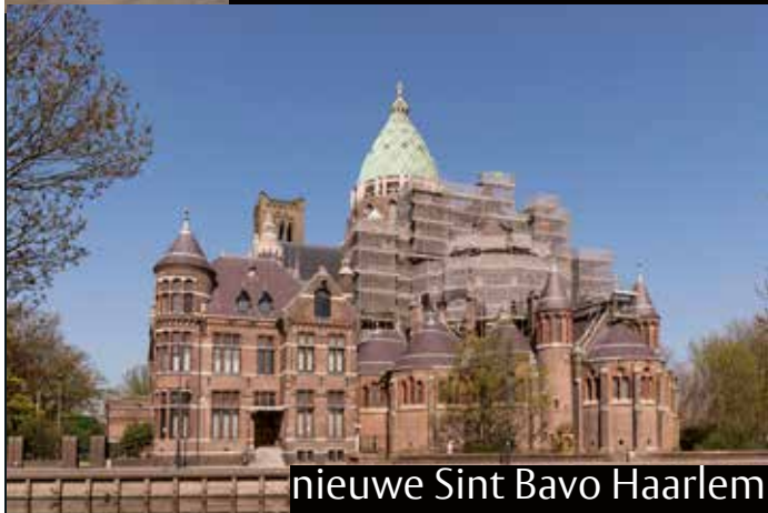
nieuwe Sint Bavo Haarlem