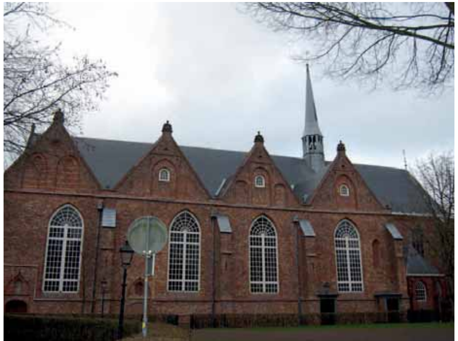
De Grote of Jacobijnerkerk.

De kerk maakte oorspronkelijk deel uit van het in 1245 gestichte Dominicanerklooster. Dit werd gesticht door de volgelingen van Dominicus