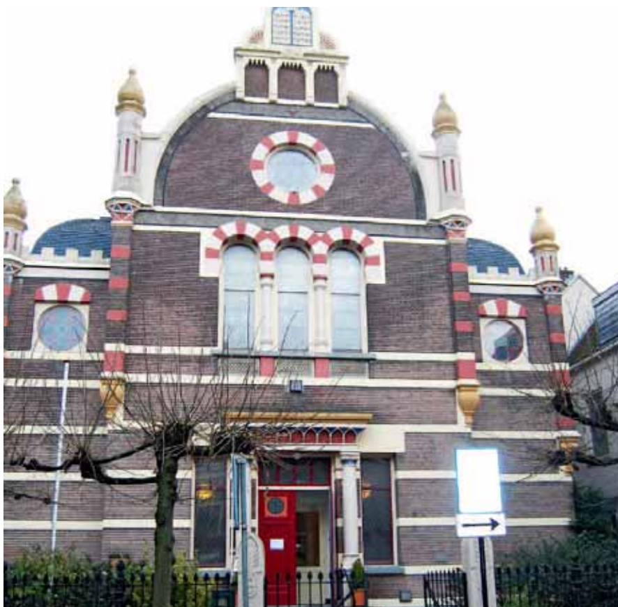
Voormalige Synagoge te Deventer.

Vervolgens geeft de heer G. van Hasselt, bestuurslid van de VBMK, een toelichting op het programma van deze middag waarvan er in deze samenvatting een tweetal bijdragen is opgenomen. De aanleiding voor deze bijeenkomst, die als titel heeft "Vitaal gebruik van kerkelijke gebouwen in Overijssel", vormt de kerkverlating en de secularisatie die ook in Overijssel bepaalde vormen gaat aannemen. Kerkelijke gemeenten worden geconfronteerd met bezuinigingen en reorganisaties en in het laatste geval kunnen zij voor de keuze komen te staan het kerkgebouw te sluiten, af te stoten of zelfs tot sloop over te gaan. Van de hedendaagse kerkbeheerder wordt ook innovatief beheer verwacht, van kosten tot cultuurondernemer en niet in de laatste