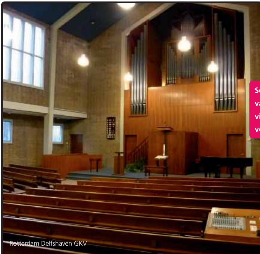
Rotterdam Delfshaven GKV

Een goede verstaanbaarheid in de kerk is niet altijd eenvoudig te realiseren. Door een veelheid aan akoestische factoren is het nodig een professionele en ervaren partner in te schakelen.