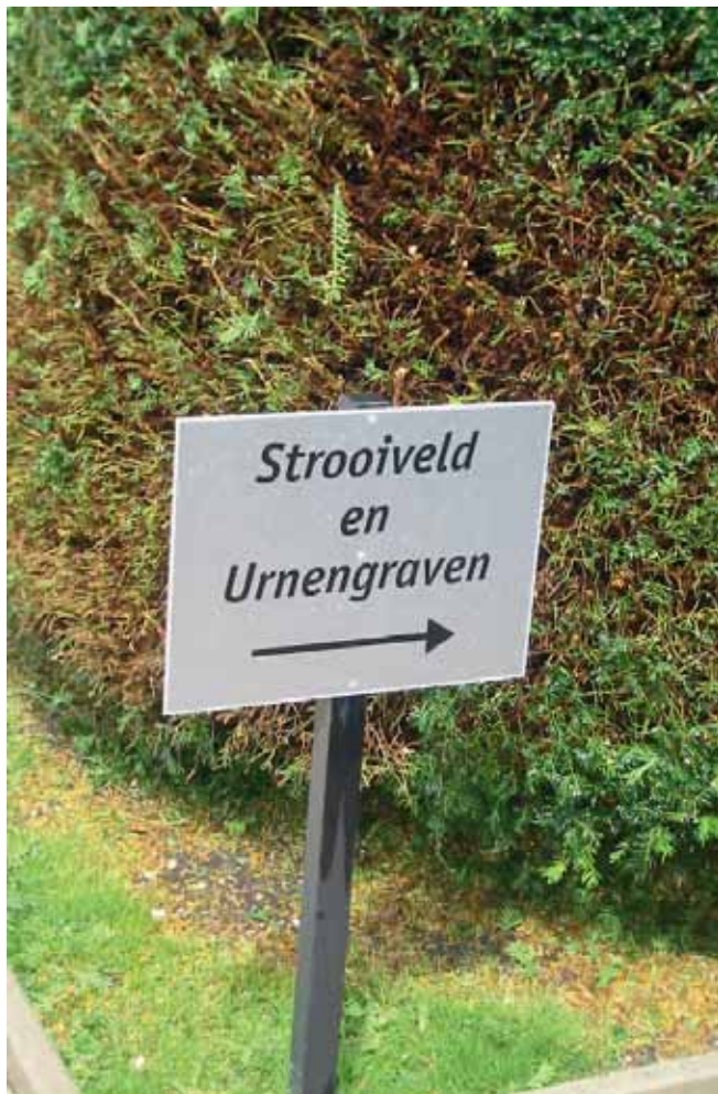
Mededelingenbord op de kerkelijke begraafplaats van Hardegarijp.

van een asbus. Een asbus kan worden bijgezet in of op een graf of op een afzonderlijke plaats op een begraafplaats. Een asbus die de as van leden van families bevat die een particulier graf dan wel grafkelders op eigen grond bezitten, kan ook daar worden bijgezet. Dat is zelfs toegestaan op een gesloten begraafplaats. De bijzetting van een asbus in of op een particulier graf, dus een graf waarop een uitsluitend recht berust, kan alleen plaatsvinden met toestemming van de rechthebbende op het particulier graf.