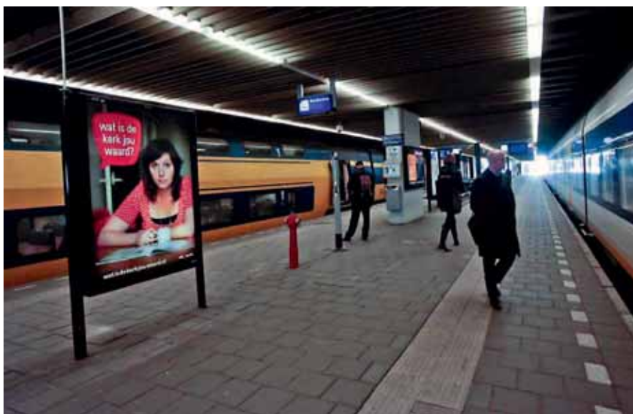
Kerkbalansposters op de stations.

Over het verloop van de actie Kerkbalans 2012 in de Protestantse Kerk in Nederland kan pas komende zomer een betrouwbaar beeld worden gegeven, wanneer colleges van kerkrentmeesters hun opgave over de resultaten van Kerkbalans 2012 aan de RPG hebben gedaan.