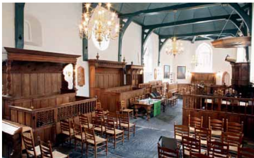
Interieur van de Dorpskerk van Huizum.