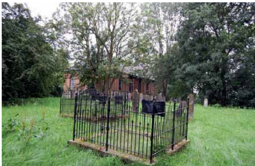
Kerkhof rondom kerk te Wittewierum.

Een aantal jaren later is het totaal verwilderde kerkhof opgeschoond zonder er evenwel een keurig aangeharkte dodenakker van te maken. De sfeer van het romantisch verval die dit kerkhof zo bijzonder maakt, is onaangetast gebleven. Niet altijd zonder enig risico voor het totaalbeleid is op sommige plaatsen — Wittewierum is er een van — door de toevoeging van een kunstwerk een eigentijdse noot aan het historische ensemble van gebouw en groene omgeving toegevoegd", aldus de publicatie in "Groninger Kerken".